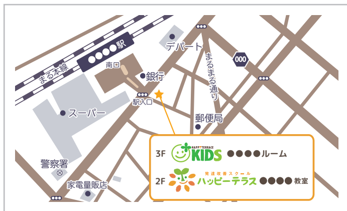
例① 放課後等デイサービス + KIDS