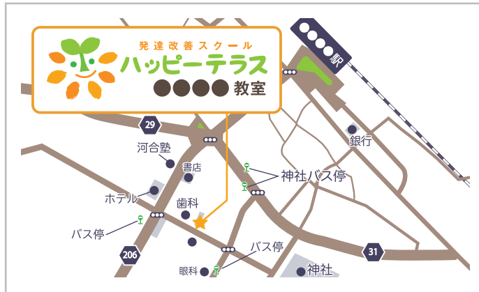
例① 放課後等デイサービス